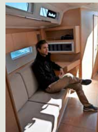
Ruim voldoende hoofdruimte onder het gangboord. De rugleuning is erg recht.

Ter vergelijking D-sailer 23 SA/D: 20 D/L: 154 TRS: 6,0 knp