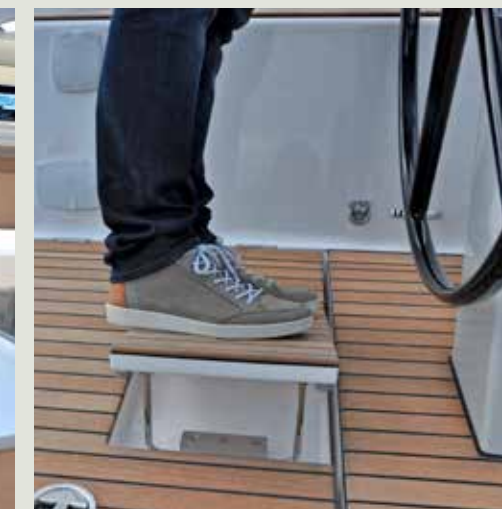
Handige plankjes voor de stuurman om onder helling recht te staan.