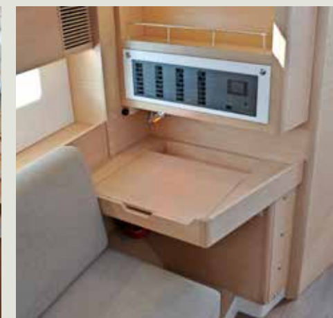
De navigatietafel is te laag om achter te kunnen zitten.