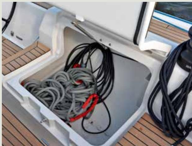
Kleine bakskist aan bakboord. Handig voor lijnen.