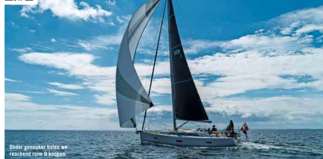
Onder gennaker halen we reachend ruim 9 knopen.

Bij de eerstvolgende windvlaag accelereert de boot direct. Niet abrupt, maar zeer zelfverzekerd. Gezeten op het gangboord past er een been aan elke kant van het stuurwiel, zodat je naast de grootschoot ook de genualieren kunt bedienen; prettig en veilig als je de boot in je eentje vaart. Daarnaast kun je de overloop vanaf beide boegen bedienen. We maken een paar slagen en noteren de kruishoek. Koers noteren, overstag, snelheid maken en weer de koers noteren. Het verschil is ongeveer 80 graden. Een mooie hoek als je een loefduel aan wilt gaan.