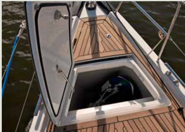
Zeilberging in de punt: bijzonder bij deze bootlengte.