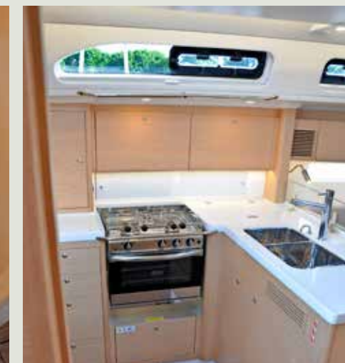
Nette kombuis. Hier met optionele extra koelkast onder de gootsteen.