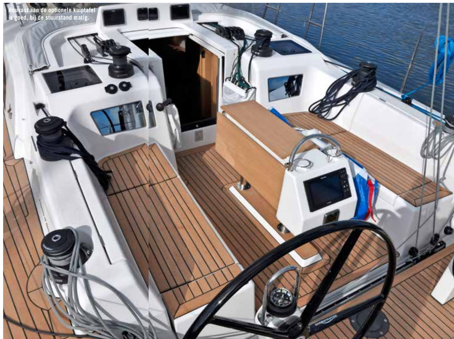
Houvast aan de optionele kuintafel is goed, bij de stuurstand matig.

met de gennaker hoogstens een pietsje loefgierig op het roer. Het zeilt prachtig.