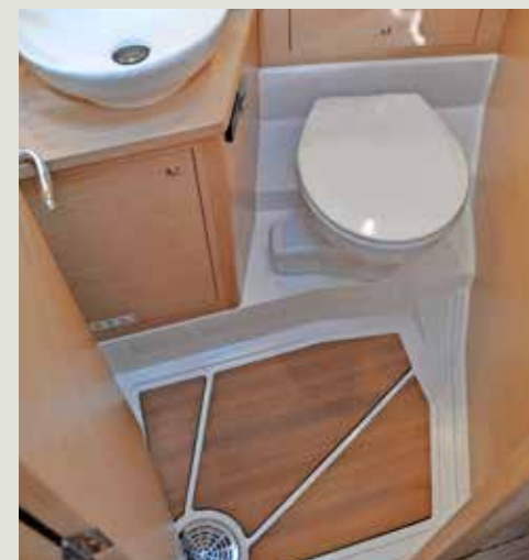
Compacte toiletruimte in eigenaarshut.