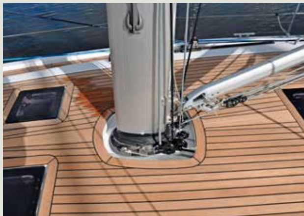
De aluminium mast is doorgestoken. Alle lijnen lopen onderdeks.