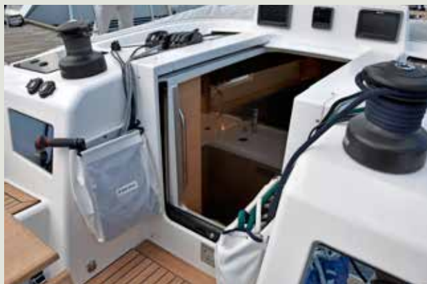
Het enkele vloedbord zakt handig weg in de 'drempel'.