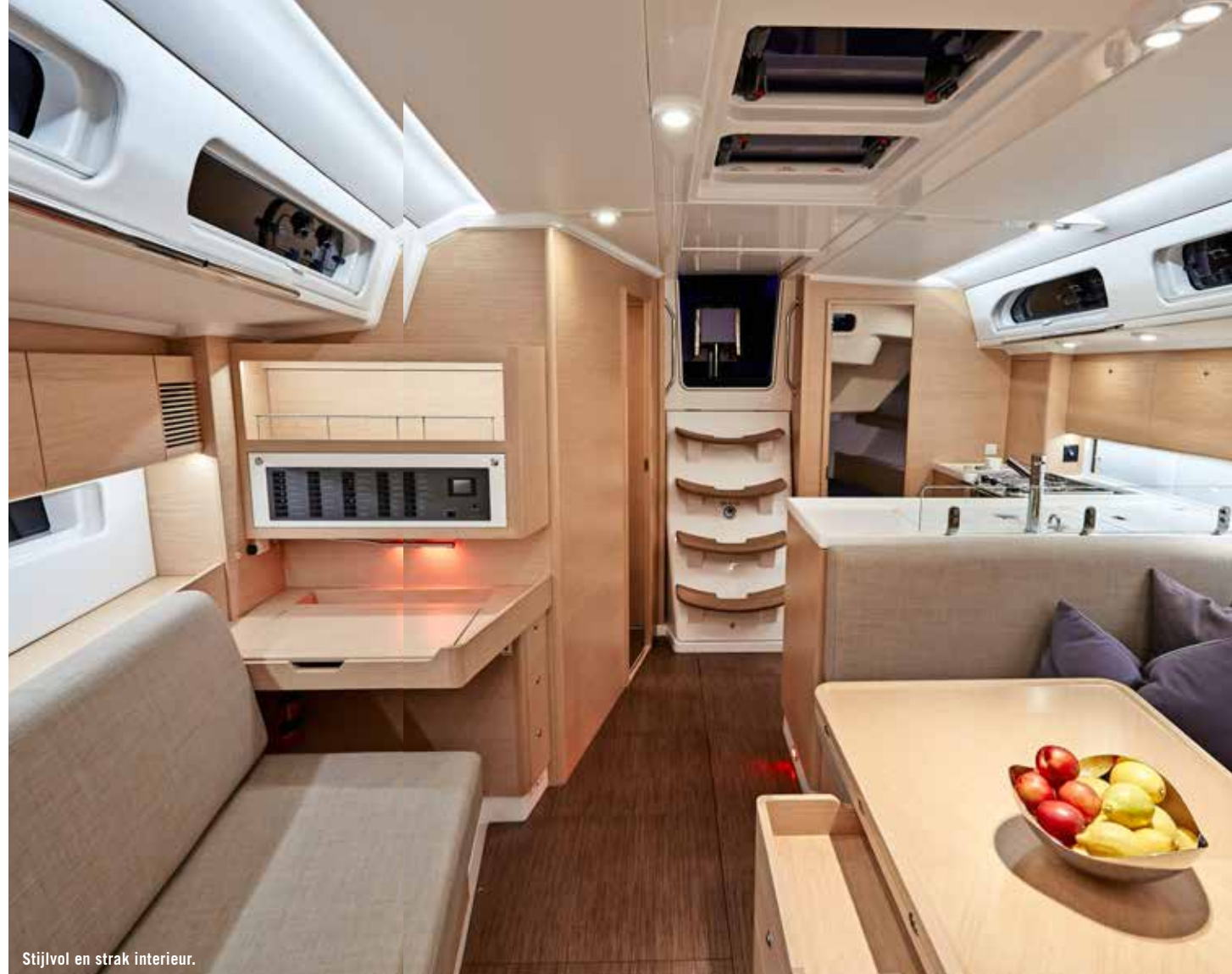
Stijlvol en strak interieur.

De boot maakt nog iets meer helling en blijft daarna liggen op de afgeronde kim in het vrijboord. De X4 voelt zoals verwacht heel stevig en stabiel aan. Door de diepe kiel en de hoge mast is het geheel behoorlijk stijf. Bovendien vormt de kiel maar liefst 43 procent van het totaalgewicht, bijna tien procent meer dan dat gebruikelijk bij soortgelijke, seriegebouwde jachten. Met gemak halen we al reachend (113 graden ware windhoek) een snelheid van 9,8 knopen. Varen we lager, dan moeten we bijna twee knopen inleveren, maar bij 11 knopen wind is dat alsnog een nette score. De boot voelt zowel op ruime koers, als hoger